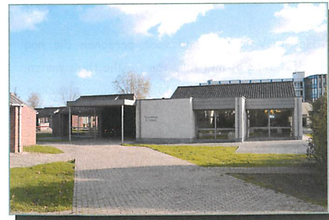
Centrum voor Dagverzorging

Ondersteuning om zo lang mogelijk thuis te kunnen wonen